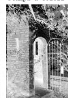
Simulazione negativo b/n

Spiegazioni: Scansione del negativo Con Diodocon Agfa 440 2400x3380 da 24x36 mm Stampa a colori I: Stampa chimica con sistema tradizionale Stampa a colori II: Stampa chimica con sistema ibrido Stampa in bianco/nero - Su carta b/n classica VC - Su pellicola ortho