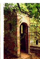
Stampa a colori II