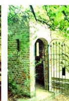
Simulazione E-6 (dia)