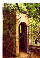
Stampa a colori I