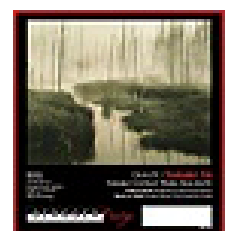
FINE-ART PROTRAIT MAT