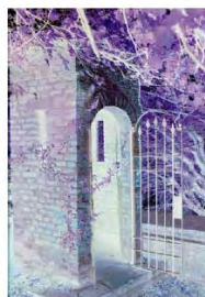
Negativo Rollei C-41 Digibase® CN 200 Pro Supporto PET - neutro (senza maschera)

que sia l'applicazione, i risultati saranno ottimali